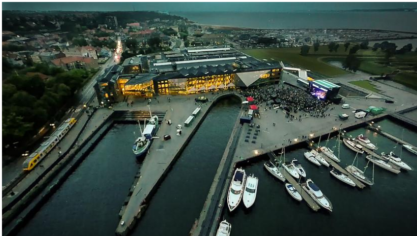
Културното пристанище 21

В едно иновативно интерпретиране в духа на културното наследство на датския град, изоставената и разрушаваща се зона на бившата корабостроителница и процъфтяващият, намиращ се сред индустриални руини, Замък Кронборг, са били обединени в един широкообхватен проект за предефиниране не само на района, но и на целия град - Културно пристанище Кронборг. Пристанището, градът и замъкът са свързани в този проект, в който са инвестирани над 1 милиард датски крони.