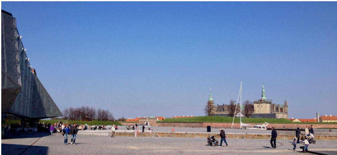
Културно пристанище Кронборг и Двореца Кронборг, Хелзингьор, Дания 19