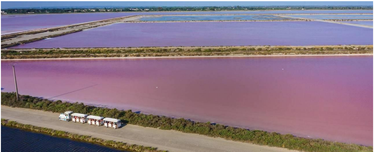
Снимка на солниците Aigues-Mortes, Камарг, Франция 25