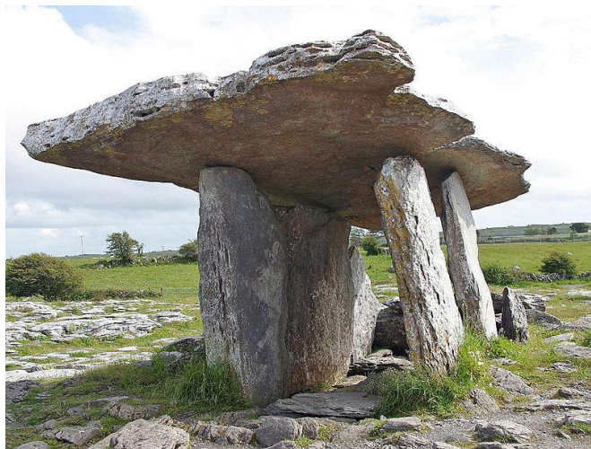
Долменът Полнамброн, неолитен вход на гробница 4

Западната зона на Ирландия и областта Клеър са известни и като източник на традиционна ирландска музика, а фестивалите и концертите се провеждат от февруари до октомври всяка година.