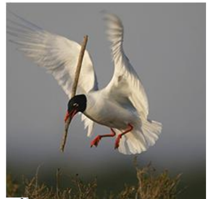
Флора и фауна в солниците на Aigues-Mortes 34

Компанията „Le Salins du Midi“ е разработила набор от туристически дейности, посветени на посещенията и опознаването на солниците в Aigues-Morte, с лого фламинго. Този набор от дейности предлага екскурзии с гид, наблюдение на птици и разходки с малък туристически влак по цялата територия на солниците, свободни пешеходни разходки или с колело, експедиции с автомобили, посещение на малък музей, посветен на вековната дейност на събиращите на сол, на биоразнообразието и на историята на марката „Le Saunier de Camargue“. Тук се организират културните събития с кулинарна специфика - Дни на наследството - ежегодно на 16 и 17 септември, Бяла вечеря в солниците и достъп до дивия плаж на брега на Средиземно море. Магазинът в Aigues-Mortes предлага разнообразна гама от продукти, от известното Цвете от сол, до ароматизирана по специални рецепти сол, соли за вана, свързани предмети и местни продукти. Ресторантът на обекта е на разположение на туристите за бързи закуски.