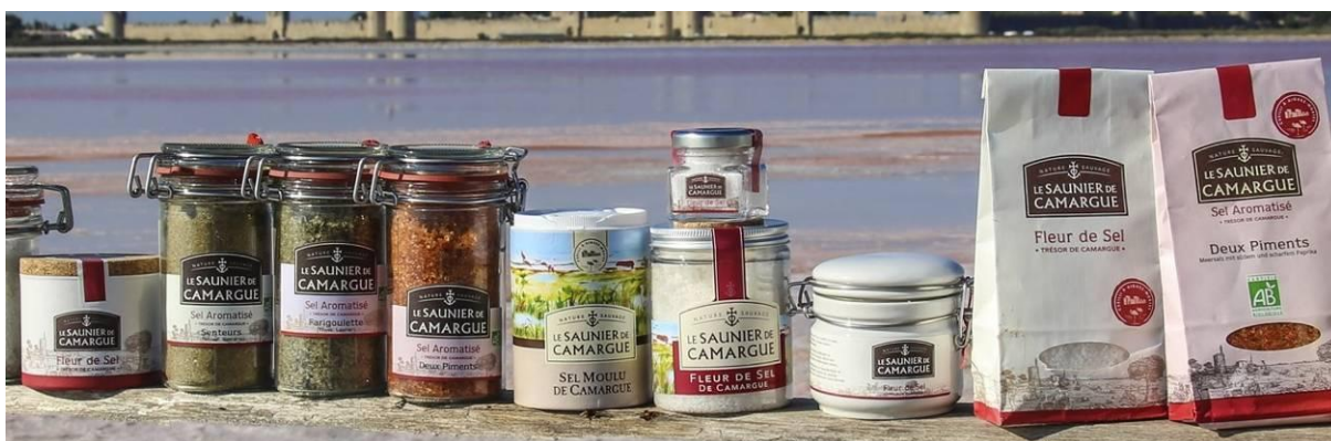
Гама продукти от марката Le Saunier de Camargue 33

Историята на компанията започва през 1856 г., в град Aigues-Mortes, там където е най-старата добивна зона и където компанията основава марката „Le Saunier de Camargue“ (Производителят на сол от Камарг). Там фирмата формира и цялостната си мисия по отношение една от най-отговорните за уникалната екосистема солници и една деликатна сол на световно ниво: Fleur de Sel (Цвете от сол). Етапите на култивиране и обработката на солта се извършват в тясна връзка с природните цикли, така че през ранната пролет басейните се затварят, за да спрат проникването на морска вода, да позволят изпарението на наличната вода и началото на кристализацията на солта, а до месец септември се създава слой от сол с приблизителна дебелина от 9 см, който след това през месец октомври се събира ръчно от работниците. Всеки басейн произвежда различен вид кристали, които се събират отделно: фина сол, едра сол и цвете от сол.