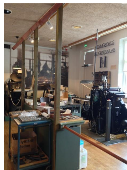
Седалище на фирма и производство 16

Бизнес-дейностите могат да се провеждат директно в открития музей, като показаното на снимката - пример за местна фирма, която включва в производството си и материали за рекламиране на Фредриксдал.