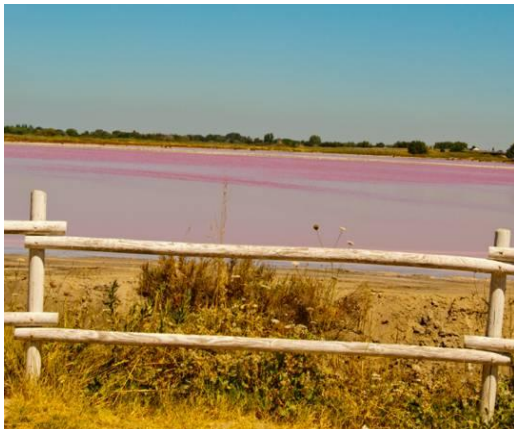
Солница в Aigues-Mortes 31

Днес, освен добива на сол и отглеждането на ориз, туризмът е основен източник на приходи за региона: Камарг се посещава годишно от над 1 милион туристи. Хората идват, за да видят едно от последните останали „диви места“ в Западна Европа. Запалените орнитолози са специална категория туристи, които идват тук в едно от най-добрите места за наблюдение на птици в света. Камарг обхваща защитени територии от различен тип Регионалния природен резерват Maistre et Musette, Биосферния резерват Камарг, Природния резерват Scamandre, блатата Carbonniere, Sensibil Marais des Gargattes, блатото Cougourlier.