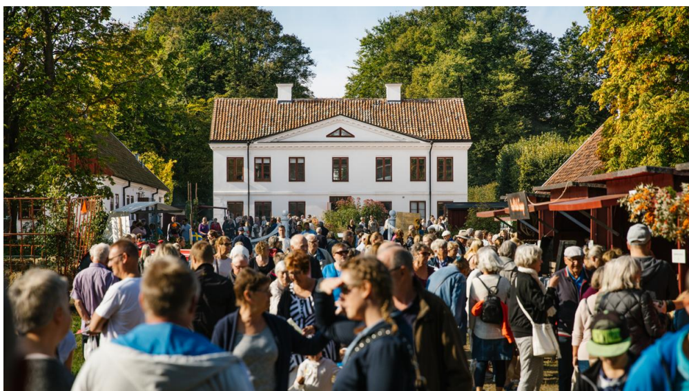
Снимка на музея Фредриксдал, Хелсингборг, Швеция 8