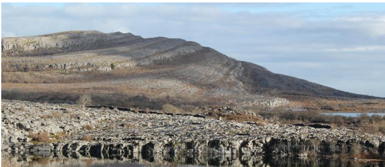
Снимка на Националния парк Бърън, Област Клеър, Ирландия 1