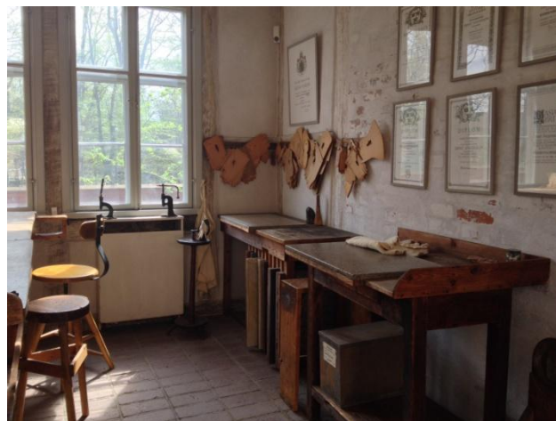
Интериори на ателиета 15

Музеят Фредриксдал дава изява на много дейности, извършвани или по инициатива на местните фирми, или чрез тяхното посредничество. Културните мероприятия - музика, театър, събития, панаири на малки производители, битпазари, танцови прояви и спортни събития, се възползват от огромната площ на имението - 36 км и от безкрайните алеи, които го пресичат.