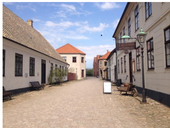
Реконструирана улица 14