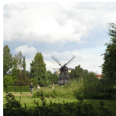
Вятърната мелница 12