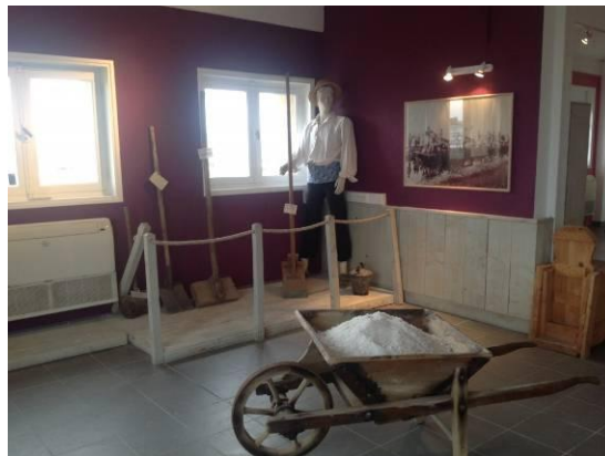
Туристически дейности предлагани от Le Saunier de Camargue 35