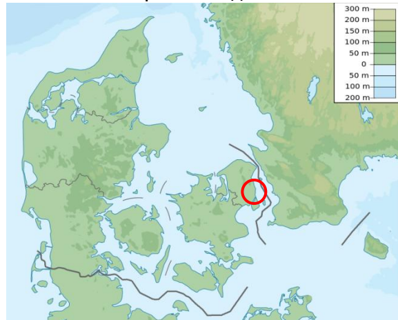
Местоположение на град Хелзингборг 20

От приходите, получени чрез преминаването на пролива, през 15-ти век е бил построен бъдещият замък Кронборг, наречен така след разширяването му през 1580 г. Замъкът е бил издигнат, за да доминира над целия пролив и да убеди корабите да плащат на митницата, а от друга страна, чуждестранната навигация да се окаже в датската армия. Замъкът е играл тази своя роля в продължение на 400 години.