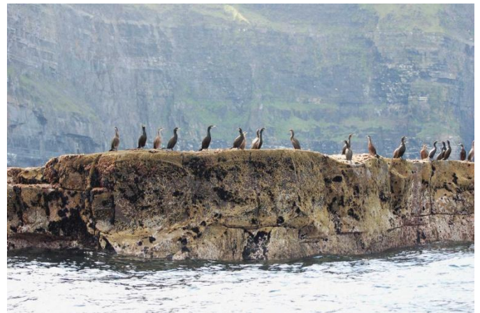
Снимки на Скалите на Мохер и на защитената местност 3

Местността Бърън е с уникален варовиков пейзаж, който прилича на лунен, с изключителна флора и фауна и е домакин на множество исторически и праисторически паметници. Това е