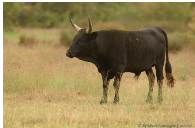
Бик от Камарг 32