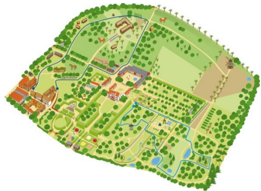
Карта на музея Фредриксдал 10

Откритият музей Фредриксдал се простира на площ от 36 хектара, в средата на град Хелсингборг. Музеят включва паркове и градини с различни теми и приложения, застроени зони сгради на различна възраст, селски, градски, оригиналната сграда на имението, като всички са функциониращи и се използват както за икономически дейности, така и като музеи, ферми, в които се практикуват традиционни методи и се отглеждат екологични продукти, зеленчукови и овощни градини, билкова градина и ботаническа градина с местни видове.