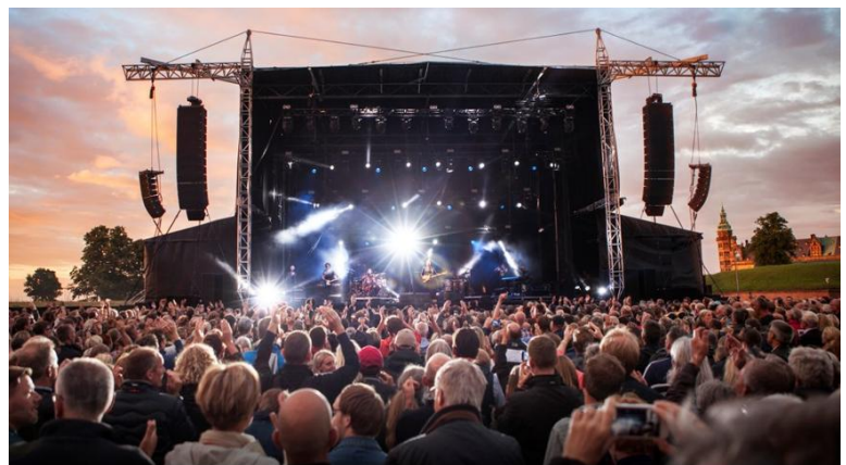
Концерт на еспланадата на пристанището 23

Креативните индустрии са, разбира се, най-изявени в пристанищните дейности, посветени на всички възрастови групи, на местните и на туристите: музика - ежегодни фестивали или концерти, театър, филмови прожекции, танци и други сценични прояви, литературни събития, семинари с артисти, уъркшопове и конференции на художествени теми, събития за деца, гастрономически прояви, стрийт изкуство и т.н.