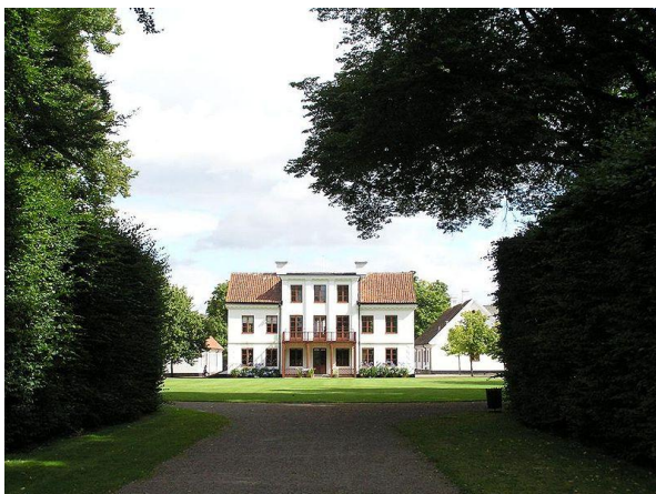
Имението Фредриксдал 13