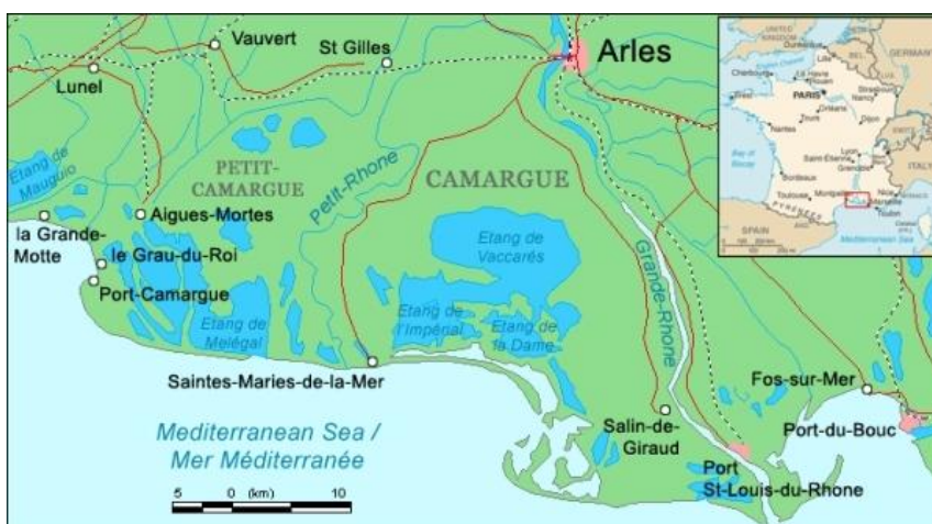
Локализиране на местността Камарг, Франция 26

Делтата, създадена от река Рона, е най-красивата делта във Франция, най-голямата в Западна Европа и една от най-добре защитените в целия свят, като е включена в Националния парк Камарг, защитена територия още от 1970 г. Резерватът обхваща площ от 80 000 хектара, като включва блата, пасища, гори, дюни и солници. Регионът е известен с лошото си време, като над 300 дни там се проявява мистралът - студен и сух вятър, който духа от северозапад над цялата долина на Рона. Една трета от площта на делтата е строго защитена, като достъпът за хора е забранен. Тези мерки са били взети с цел запазване на редките видове растения и животни, както и за поддържане на местната екосистема. В останалата част на делтата, със специални разрешителни, се допуска лов, земеделие и добив на сол. Солниците се намират в югоизточната част на делтата, като сол се добива тук още от времето на Римската империя.